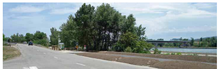
L'accès à Via-Rhône 200 m avant le pont de La Roche de Glun

http://www.openrunner.com/index.php?id=922998