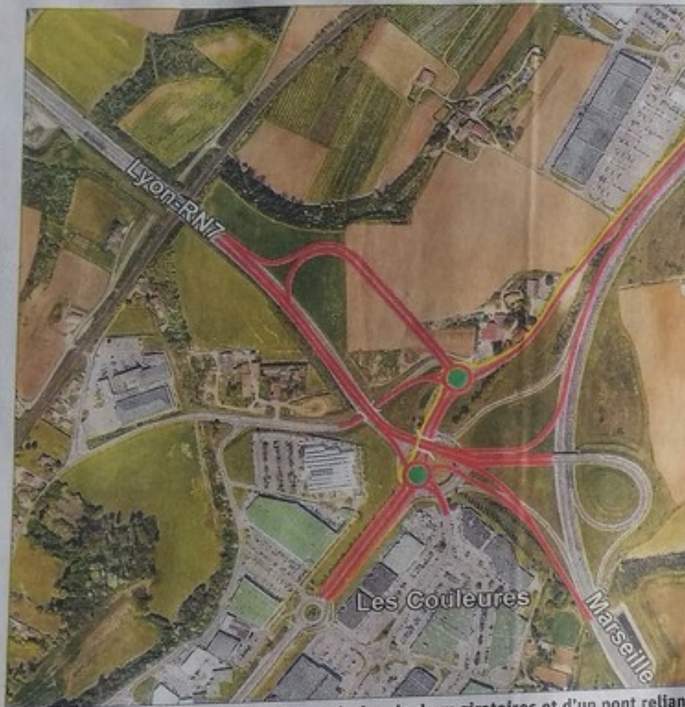
Le projet porté par la Dreal prévoit la création de deux giratoires et d'un pont reliant Bourg-lès-Valence (à gauche) à la Lacroix (à droite) pour réduire les embouteillages au Nord de Valence. Infographie Dreal

En lieu et place du grand carrefour des Couleures, aujourd'hui dangereux et embouteillé aux heures de pointe, le projet porté par la Dreal prévoit la création d'un pont reliant la nationale 7, depuis Bourg-lès-Valence, à la Lacroix, vers Grenoble et Marseille. L'ouvrage surplombera une route et deux ronds-points aux flux plus locaux. Pour joindre Valence à Saint-Mar-