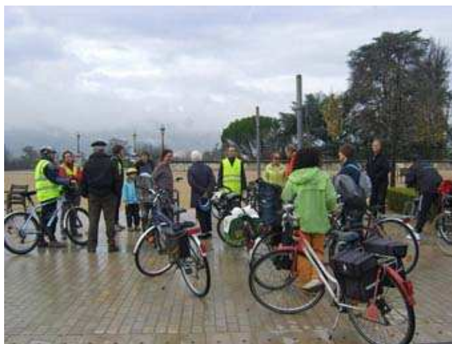
Photo avant le départ de la balade de dimanche 21 novembre. Malgré le temps mi-figure, mi-raison, 25 cyclistes étaient au rendez-vous. Très belle randonnée qui a permis de découvrir du chemin des Contrebandiers, Valence en contre-bas, notamment les quartiers des Petit et Grand Charan et celui de Chateaufort avec ses nombreux canaux.